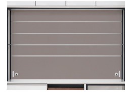
背板をB色に変えたイメージ