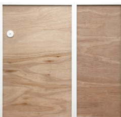
60Gと40DHを連結した裏面のイメージ