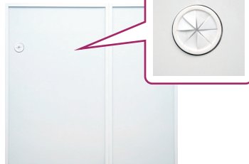
60Gと40DHを連結した裏面に化粧加工を施したイメージ