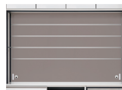
背板をB色に変えたイメージ