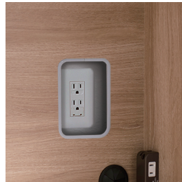
切断面を保護するモール付き

切断面には、小口を保護し、美しく整えるモール付き。加工には誤差がありますので、余裕をみて加工位置・寸法をご指定ください。