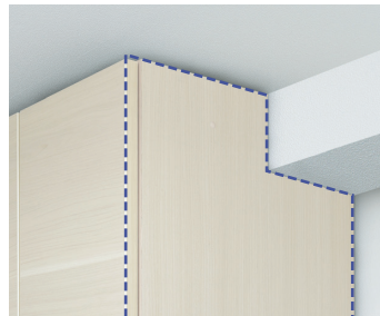
天井の梁に合わせて上置をカットします

※加工可能範囲を超える寸法でのカット加工はできません。 ※50mm未満のわずかなカット加工はできません。