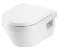
Villeroy & Boch Architectura