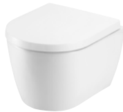
Duravit Me By Starck