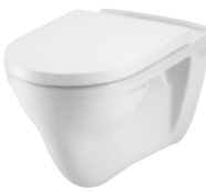
Villeroy & Boch O.Novo