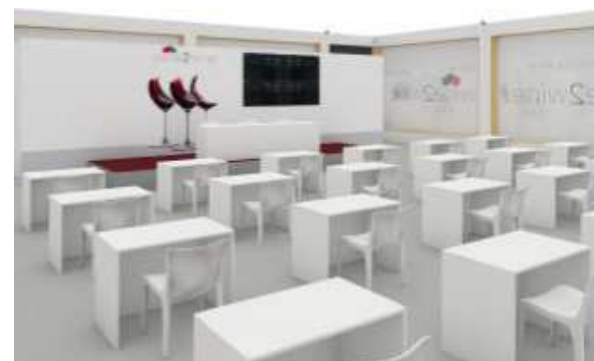
Esempio di sala degustazione secondo nuove normative

Un convegno dedicato al settore birrario e allo sviluppo dell'e-commerce, sarà il momento di incontro su tematiche sempre più attuali da quando la pandemia ha modificato le abitudini di acquisto.