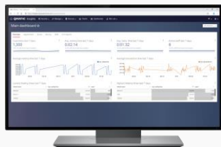
Business Intelligence – Realtidsdata & Analys