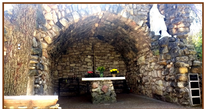
La Gruta de Nuestra Señora de Lourdes en el campus de la Universidad Saint Edwards en Austin, Texas.