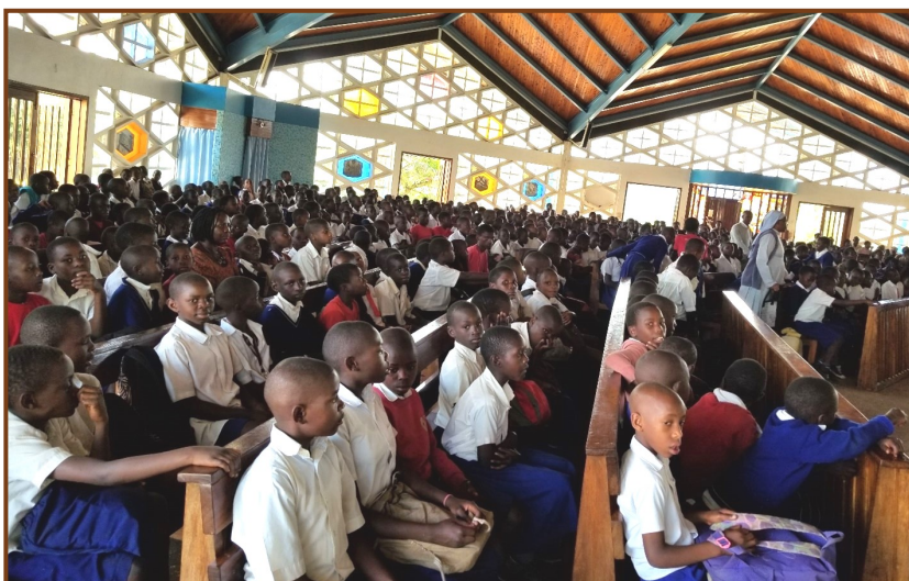
Una reunión de un capítulo estudiantil del Grupo de la Oración Padre Peyton en Fort Portal, Uganda.