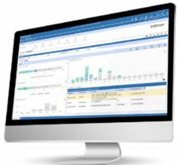
Figura 8: Administrador de Tareas

equipos financieros una visibilidad en tiempo real del estado de los procesos clave con la capacidad de tomar medidas sobre los cuellos de botella para garantizar la finalización oportuna y la precisión.