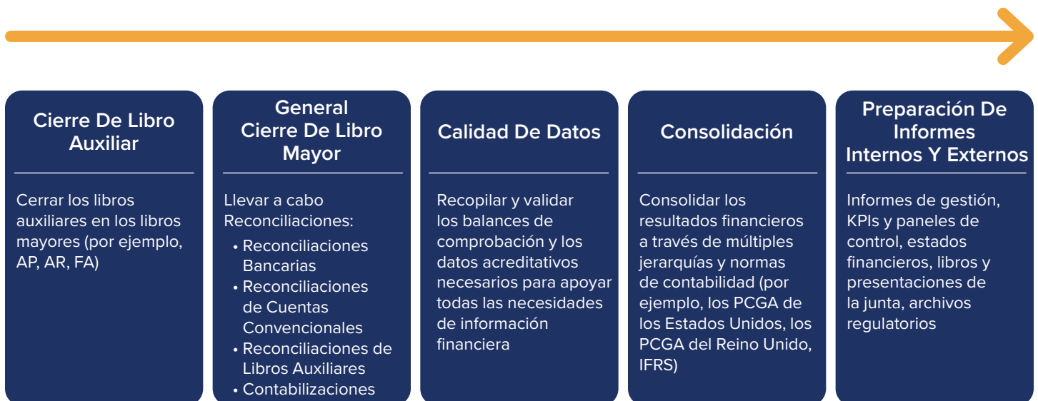
Figura 1: Proceso de Cierre Financiero, Consolidación y Reporteo

Como se ha destacado en la página anterior, a medida que las organizaciones crecen y evolucionan en complejidad, el cierre financiero y el proceso de presentación de reportes pueden atravesar múltiples lugares y departamentos, involucrar múltiples sistemas y consumir una gran cantidad de tiempo y recursos del equipo de Finanzas. La mayoría de las organizaciones ejecutan el cierre financiero y el proceso de presentación de informes mensualmente, con tareas adicionales y aún más rigurosas trimestralmente. El cierre de fin de año requiere entonces aún más tiempo y esfuerzo.