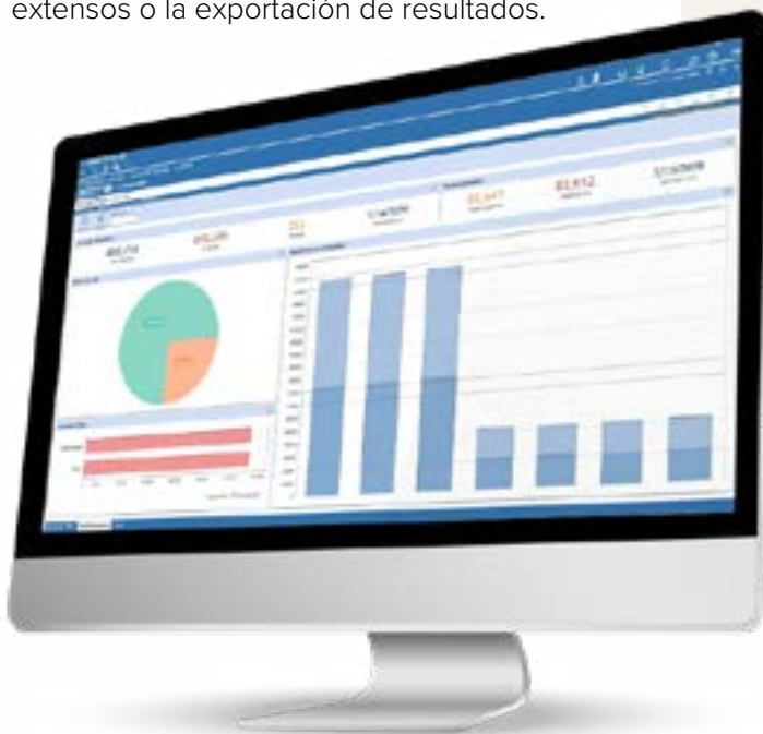
Figura 7: Transaction Matching OneStream