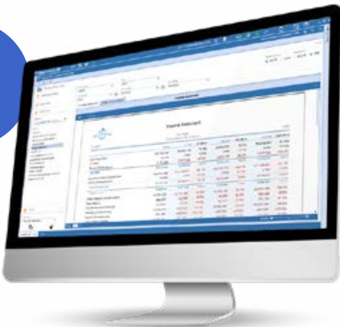
Figura 6: Reporte Guiado de OneStream