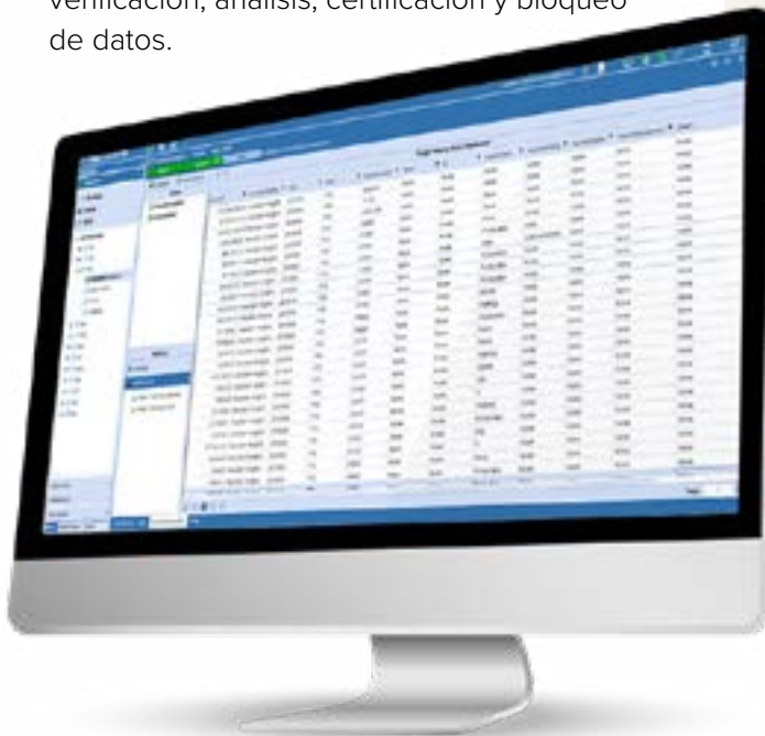
Figura 4: Flujos de Trabajo Guiados OneStream

Los flujos de trabajo guiados de OneStream (figura 4) protegen a los usuarios de la empresa de la complejidad al guiarlos de manera única a través de todos los procesos de gestión, verificación, análisis, certificación y bloqueo de datos.