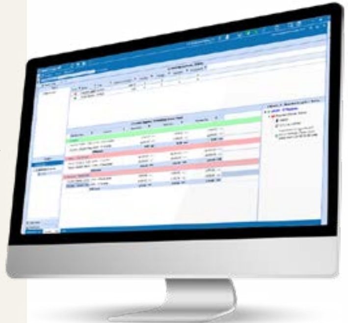
Figura 5: Comparación Intercompañía